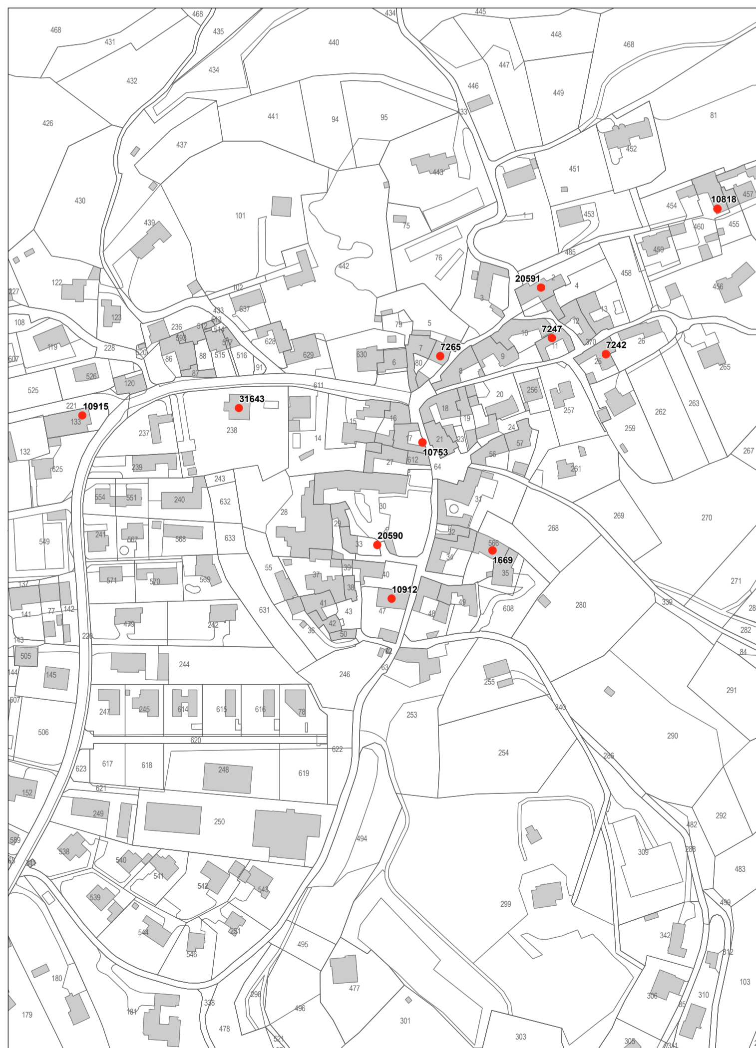
Estratto A - Nucleo di Tremona scala 1:2000

MATTEO HUBER ARCHITECTURE AND URBAN PLANNING arch. dipl. ETH SIA OTIA / Pianificatore ORL - NDS - FUS via Bagutti 45, 6900 Lugano - Tel. 091 9702182 - www.huberplan.com - info@huberplan.com