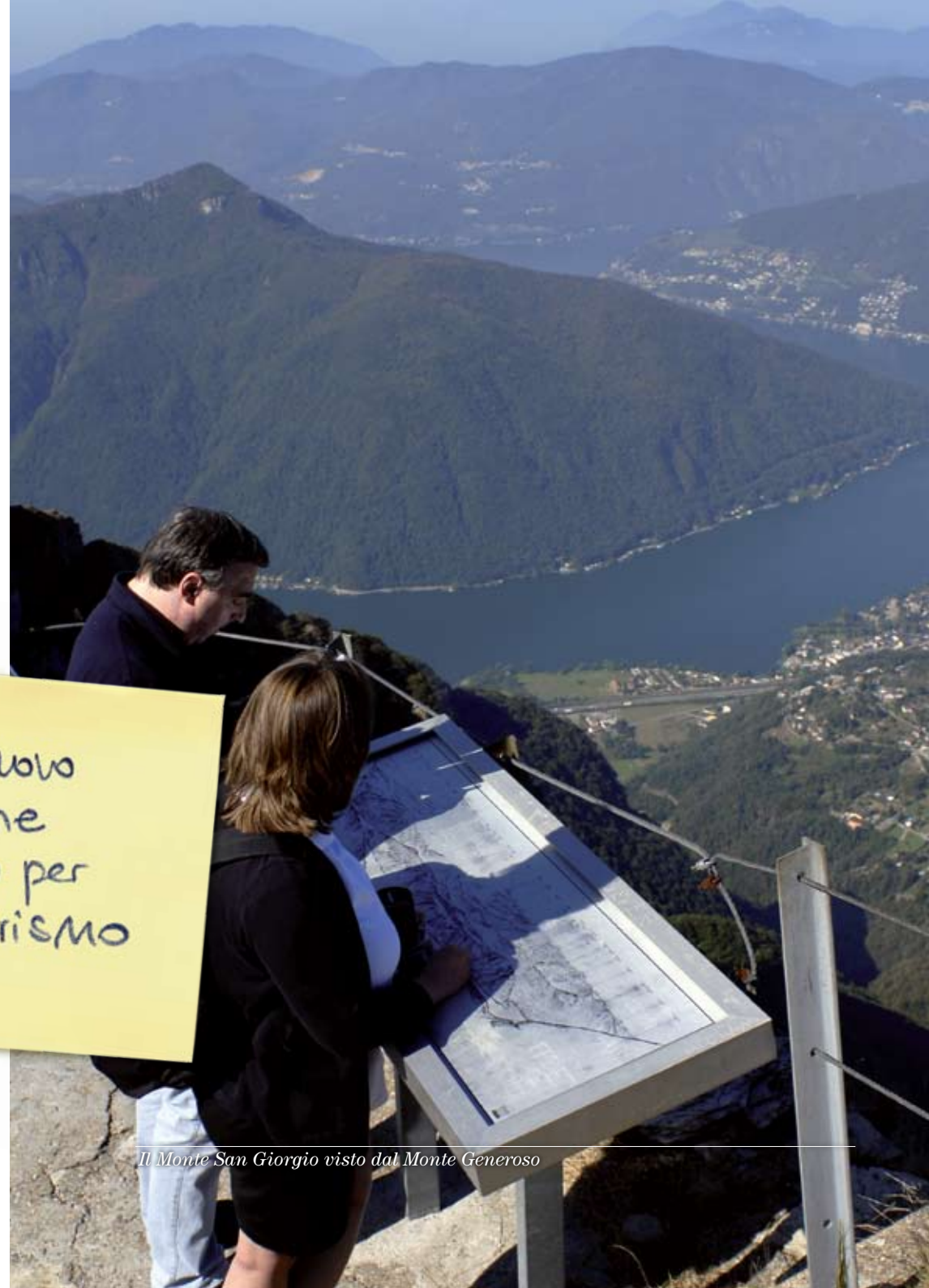
Il Monte San Giorgio visto dal Monte Generoso