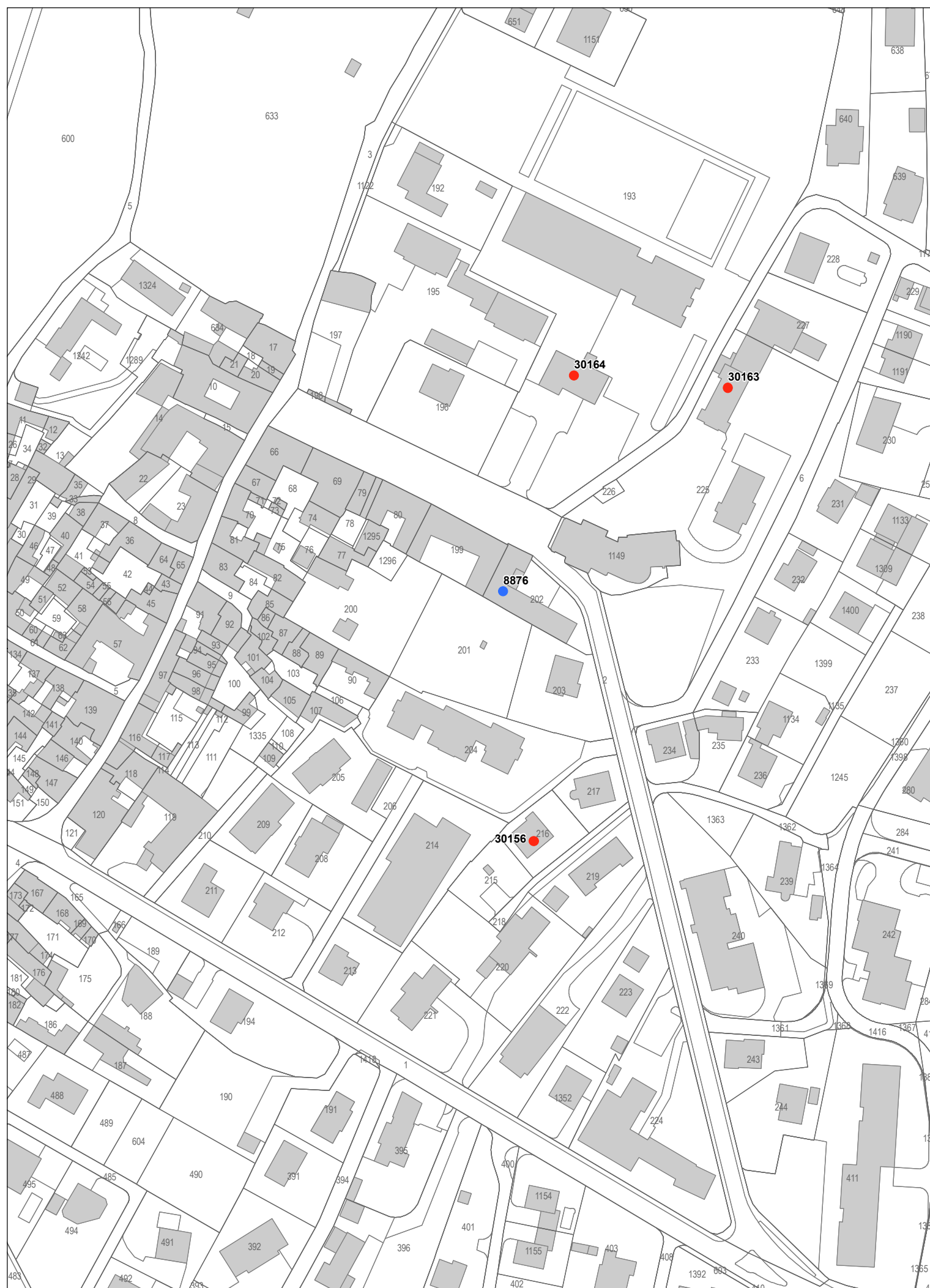
Estratto A - Nucleo di Rancate scala 1:1500

MATTEO HUBER ARCHITECTURE AND URBAN PLANNING arch. dipl. ETH SIA OITA / Pianificatore ORL - NDS - FUS via Bagutti 45, 6900 Lugano - Tel. 091 9702182 - www.huberplan.com - info@huberplan.com