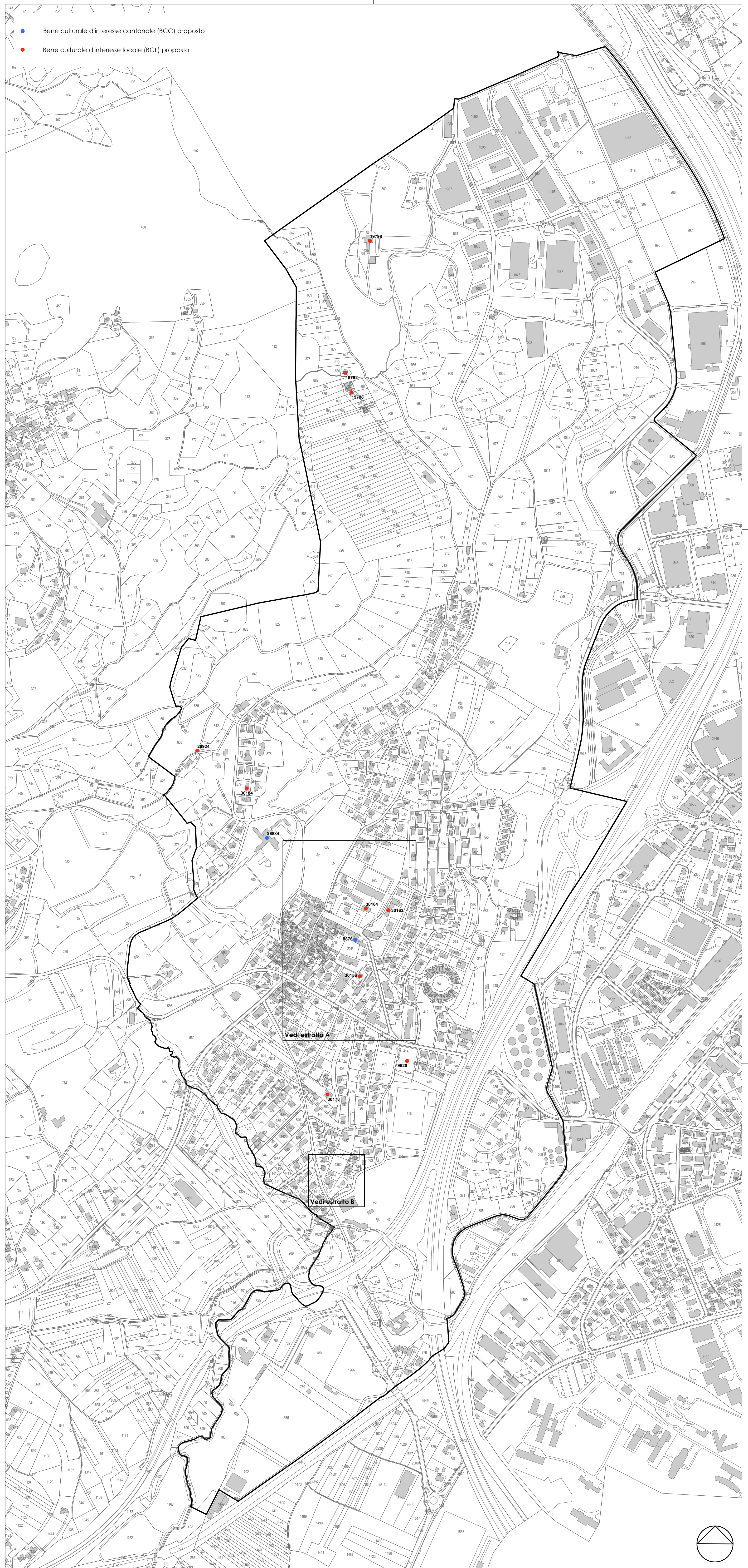
Quartiere di Rancate scala 1:4000